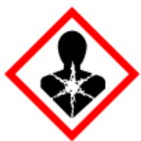
TOSSICO A LUNGO TERMINE