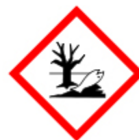
PERICOLOSO PER L'AMBIENTE