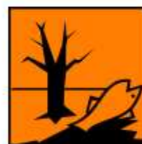
PERICOLOSO PER L'AMBIENTE

Fraasi di pericolo: H xxx (H301 = tossico se ingerito)